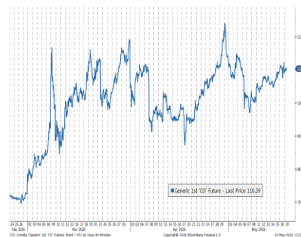
Wykres 3. Cena ropy naftowej Brent