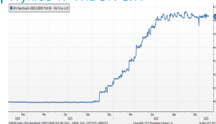
Wykres 1. WIBOR O/N

Dziś w centrum uwagi rynków będą wstępne dane o PKB za 4 kw. z Polski oraz inflacja za styczeń z USA. Kalendarz makroekonomiczny zawiera także dane o PKB za 4kw. z Węgier i strefy euro.