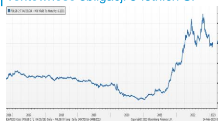
Wykres 3. Długoletni trend – rentowność obligacji 5-letnich SP