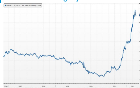
Wykres 3. Długoletni trend – rentowność obligacji 5-letnich SP