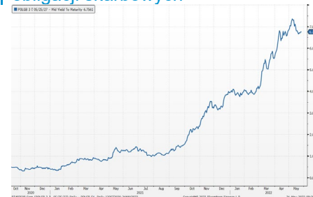
Wykres 2. Rentowność 5-letnich obligacji skarbowych